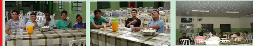
Sessão Pipoca - Residentes