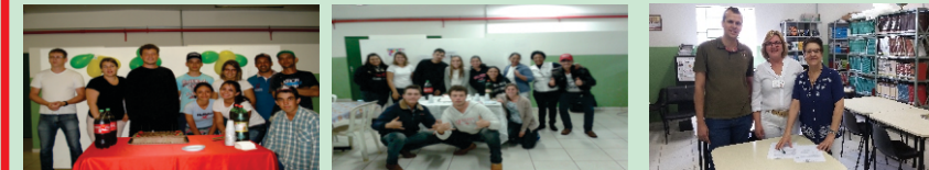
Residentes aniversariantes dos meses de jan/fev/mar e abril e maio