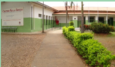
Unidade 83 - Sta. Rita do Passa Quatro - SP