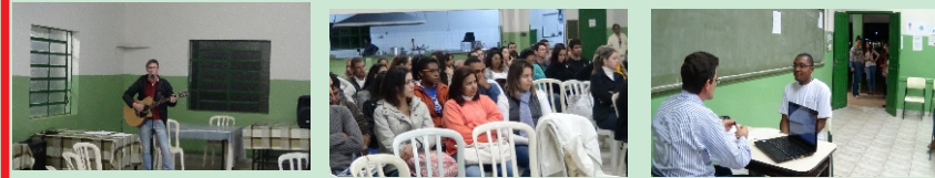
Semana Paulo Freire