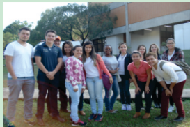
15/09 - 3º de Agropecuária