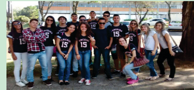
16/09 - 3º de Informática